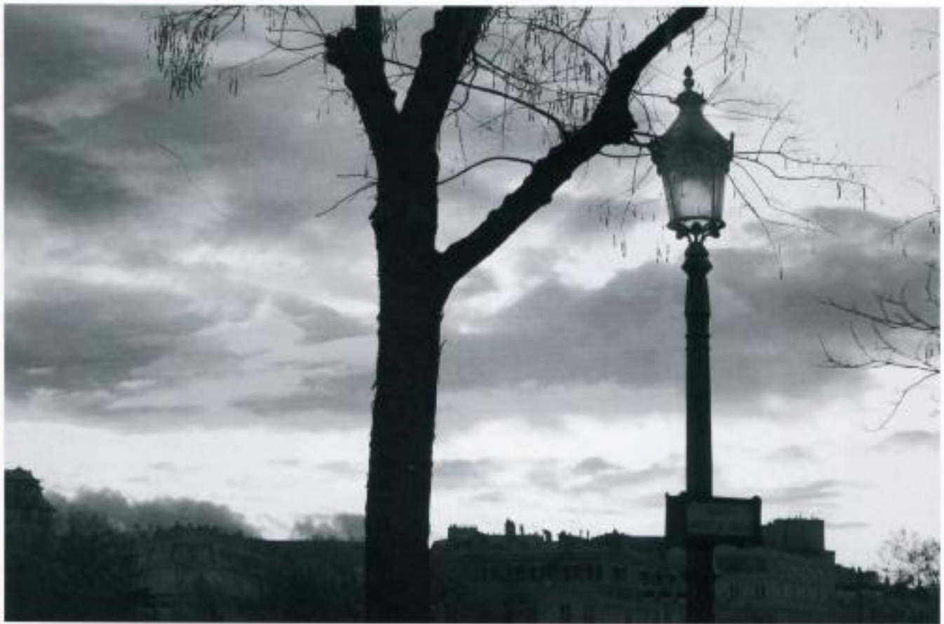
Paris Sky.

Christmas visitors, don't you agree?" Jana felt her glance resting on her. She turned around. A little conversation couldn't do any harm. "Oh, I don't mind. I like the Christmas fairy lights better than dismal Paris in December," she replied to the unknown with a sparkling smile. Light-heartedness is required, especially dealing with these dismal-weather-subjects, she had read about in the etiquette of conversation.