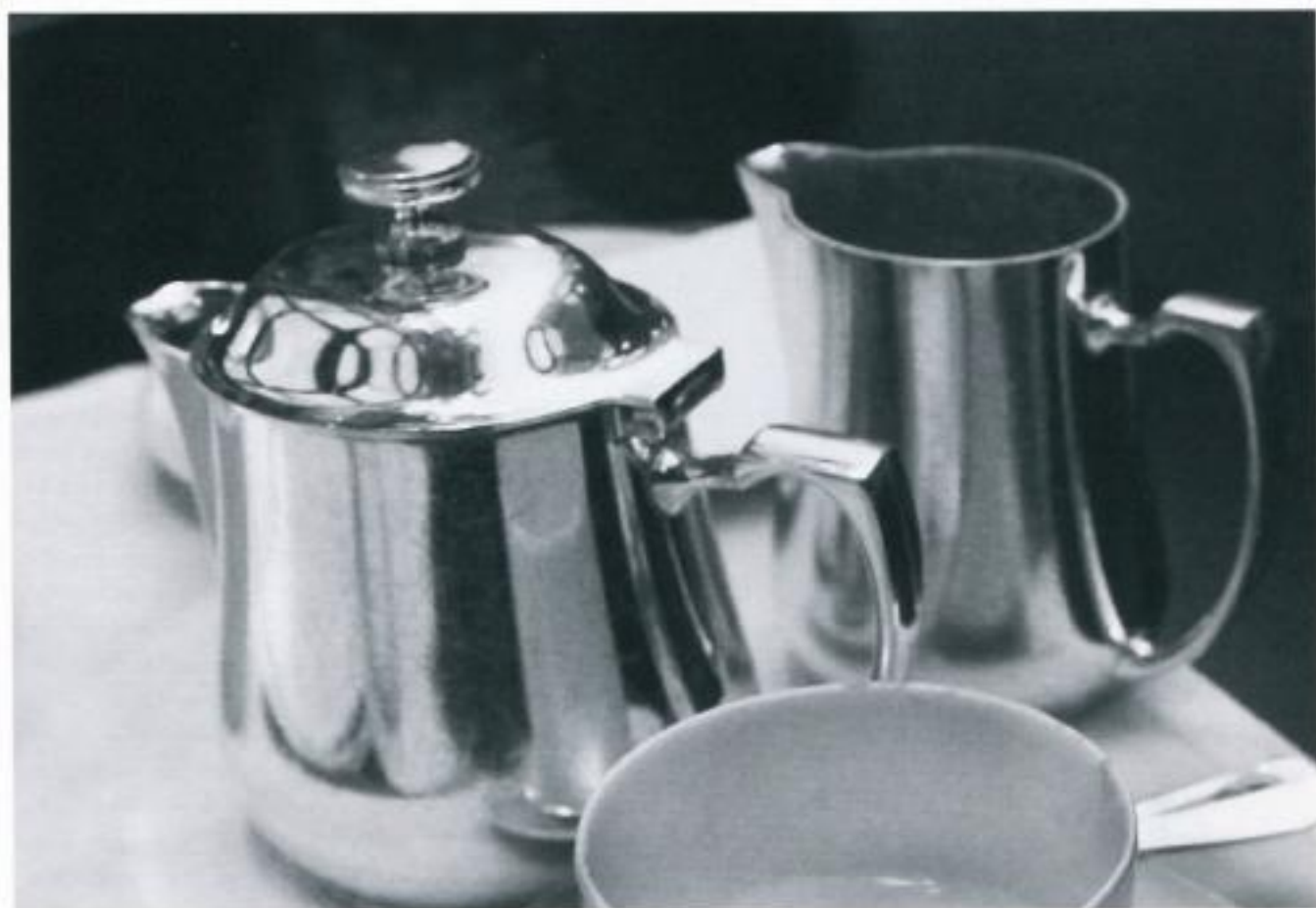
Tea in the Hotel Bar.

und malte Tag und Nacht. Ab und zu erledigte sie auch kleine Fotoaufträge und beaufsichtigte nachmittags Kinder in einer Schule. Letzte Woche flatterte plötzlich und sehr unverhofft ein Brief ihres Vermieters mit einer recht hohen Mieterhöhung herein. Solch eine Nachricht brachte Jana fast zur Verzweiflung. Ihre Nebentätigkeiten warfen nicht genügend Geld ab und weitere kleine Jobs waren in den Zeiten