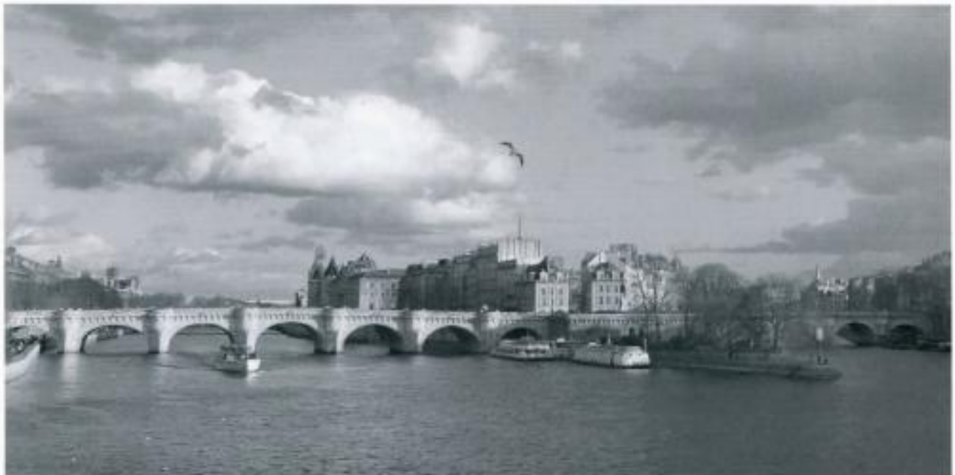
The River Seine - Paris

Ihren Tee für 10 Euro bezahlend beendete sie abrupt diesen Abend und verschwand in der nasskalten Nacht.