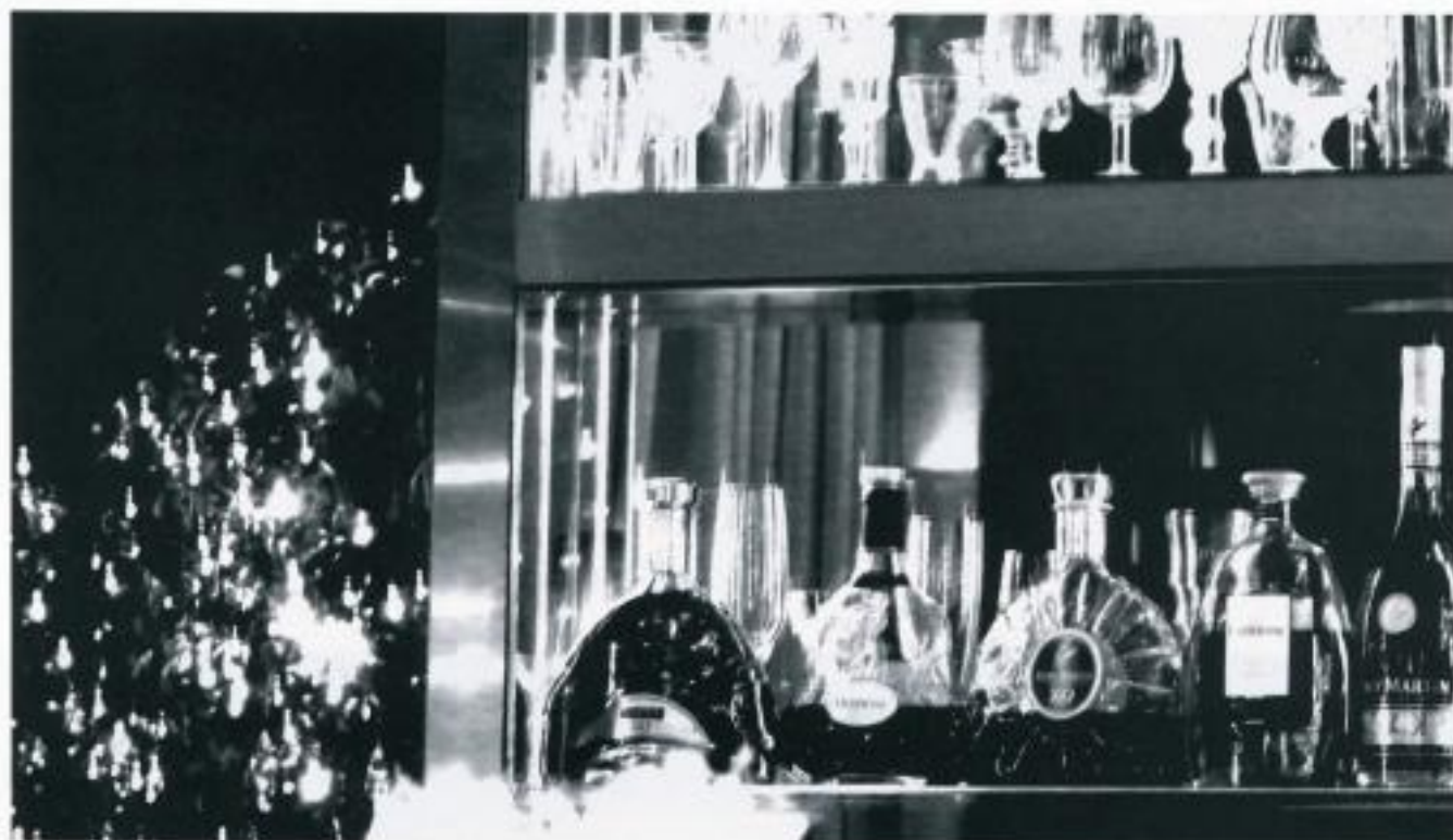
Hozel Bar

turned up at her doorstep. Such news drove Jana almost to despair. Her side jobs didn't make enough money and more small jobs weren't easy to find in times of economic crisis. "To become an escort girl, you are too old at 44. You have to enter rich circles!" her life experienced artist friend Shouponette suggested. She should know, after all she was 77 years old and a full-blooded artist. My paintings are good!