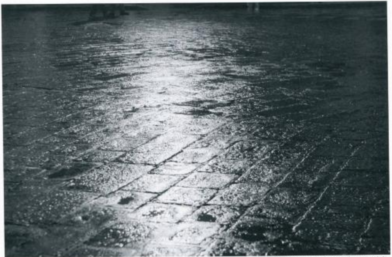
Night Lights in Town

cocktails, I will try in the evening sometime. The afternoon is too early for me having alcohol", she whispered to him trustingly. That seemed to turn out well. He looked at her understandingly: "With great pleasure, Mademoiselle." A smile was returned and then arrived first of all, a slim, noble glass with water and a slice of lemon, the welcome drink, so to say. She sipped. Refreshing, really good. She looked